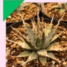
Strong Style Fukuoka