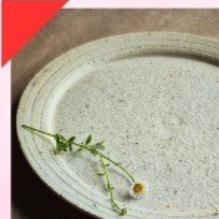
AKATSUKI BASE 暁陶芸工房